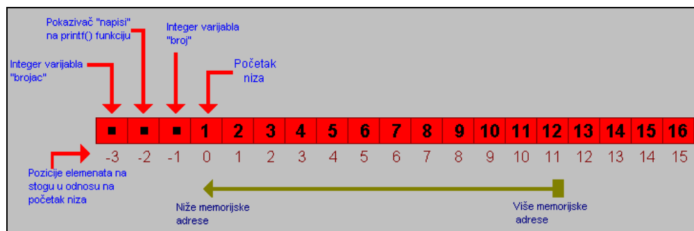
Tablica 4: Izgled stoga prilikom izvođenja integer3.c programa

Kao što je vidljivo iz priložene slike, neovlašteni korisnik može prepisati integer varijablu broj , funkcijski pokazivač napisi i integervarijablu brojac . U nastavku je priložen primjer postavljanja negativne pozicije u nizu.